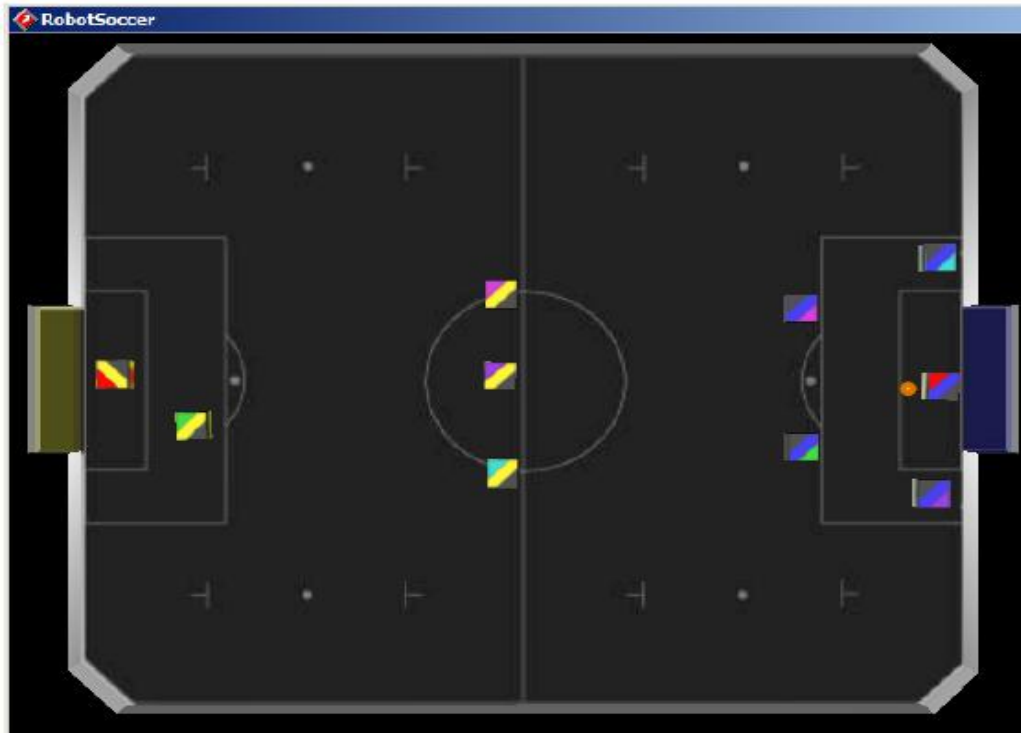
Figure 9: Position of the Ball and Robots for Goal Kick