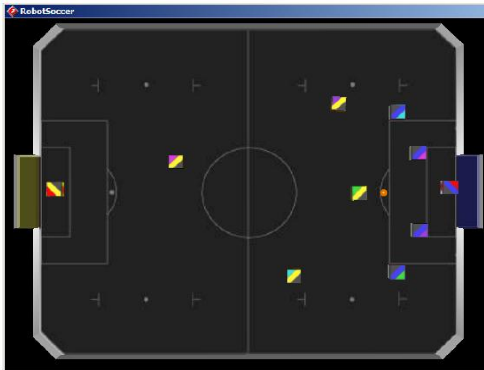
Figure 4: Position of the Ball and Robots for Free-Kick