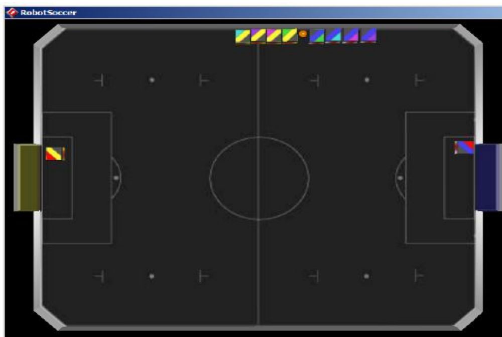
Figure 5: Call for a Free-Ball scenario 1

如图 6 所示。两支球队的其他机器人可自由地放置在争球所在的 1 / 4 场地之外。进攻方优先布置机器人。