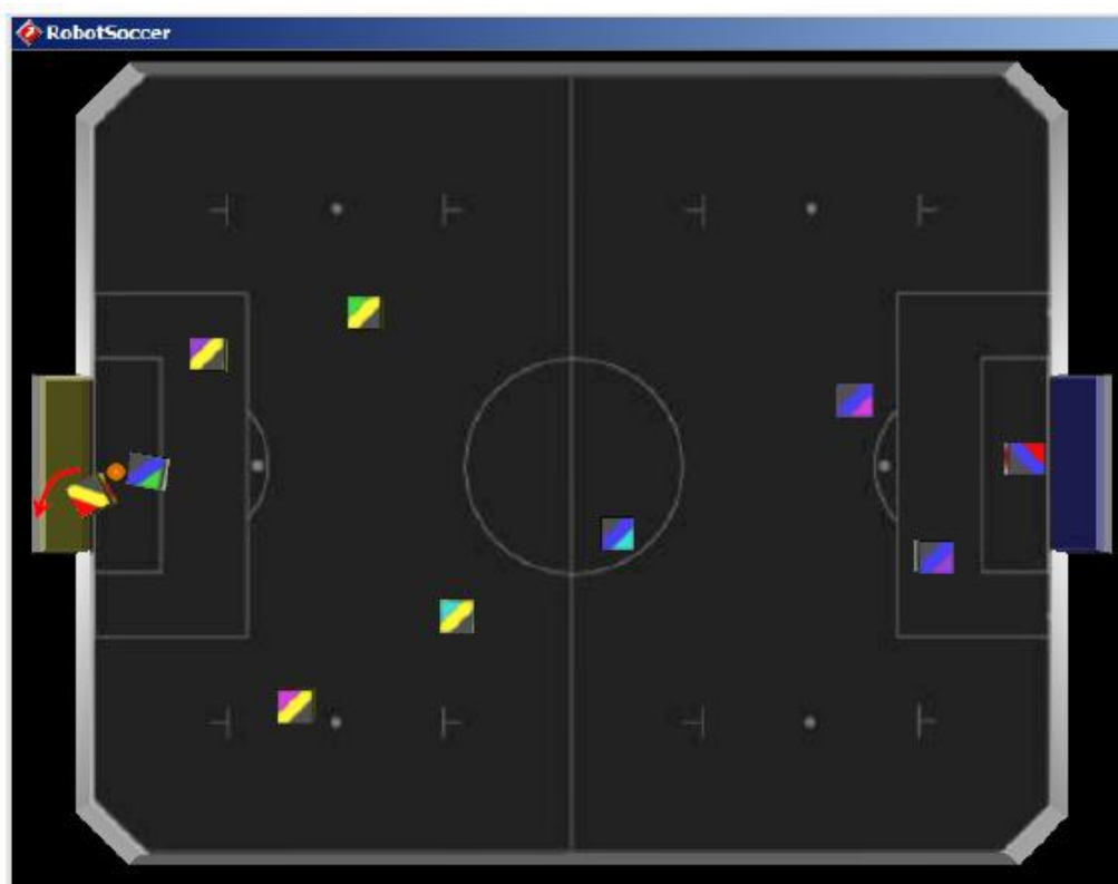
Figure 7: Scenario of goalkeeper charging