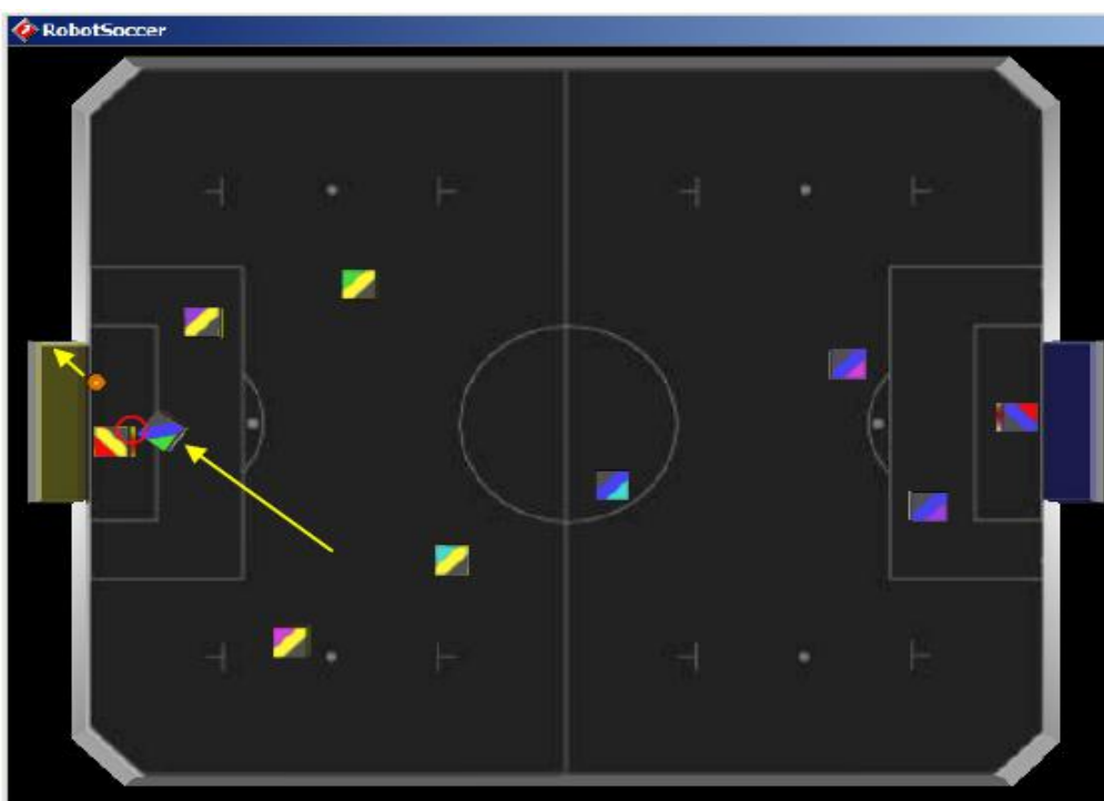
Figure 8: Scenario that shall not be regarded as goalkeeper charging