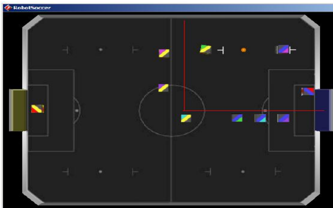
Figure 6: Position of the Ball and Robots for Free-Ball