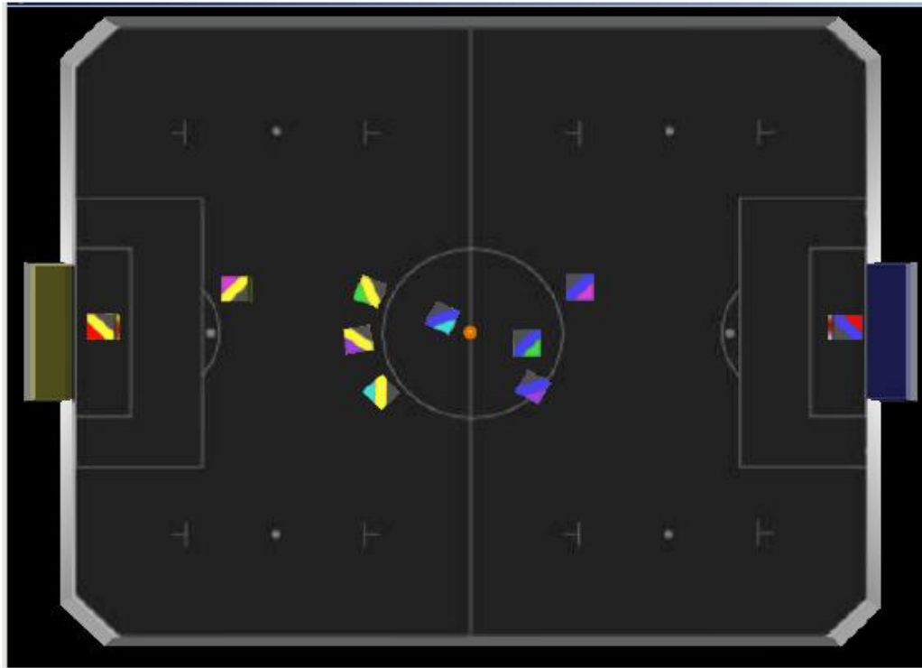
Figure 2: Place kick