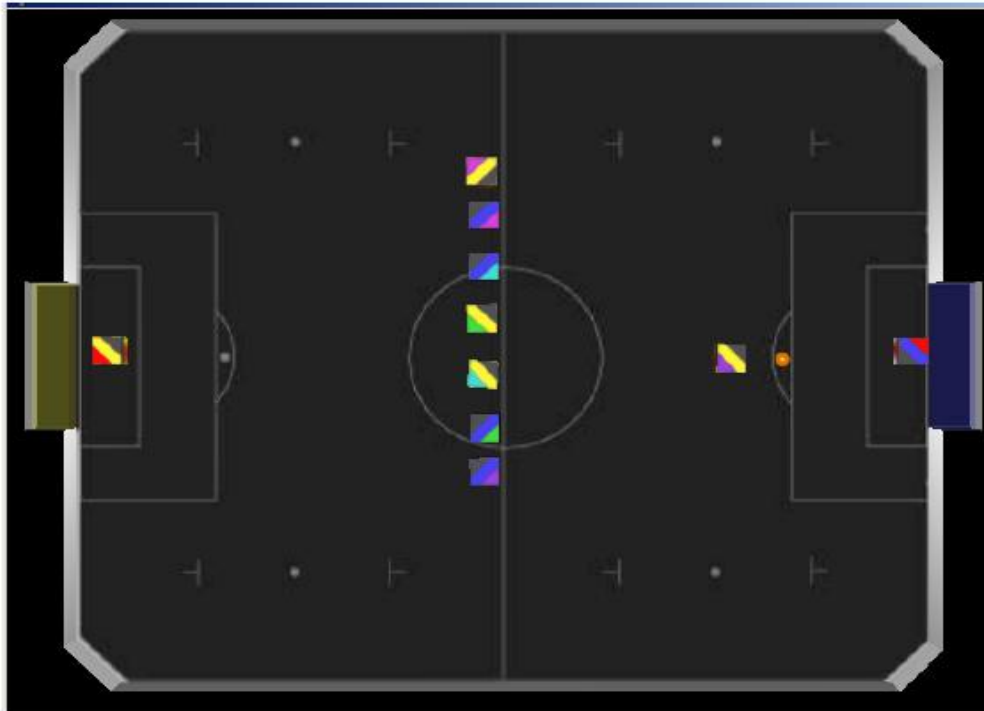
Figure 3: Position of the Ball and Robots for Penalty Kick